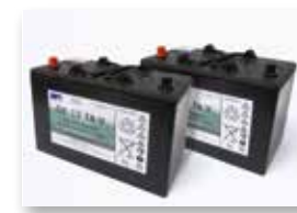
Batterie da 76 Ah