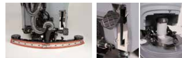
Tergitore regolabile e compatto

Tutto è stato pensato per garantire la massima produttività e permettere di lavorare senza sforzo in ambienti e superfici di differenti dimensioni.