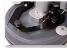
Due manopole regolazione spazzola

A batteria, manuale, con testata monospazzola (21")