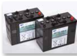
Batterie da 105 Ah

A batteria, trazionata, con testata monospazzola (21")