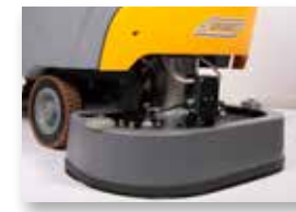
Testata bispazzola con paraspruzzi

A batteria, trazionata, con testata bispazzola (24")