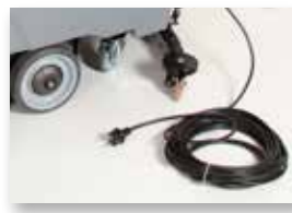
Cavo da 25 m