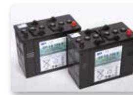
Batterie da 105 Ah